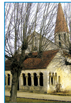
Sehenswert: Romanische Kirche in Escolives.

Romanische Kirche St.-Pierre St. Paul aus dem 12. Jh.; Schlüssel am Gemeindeamt (03 86 53 54 24).